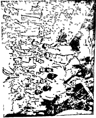
अनार रडा गुंथा गुंथा गाथावेले ि गाथा बाजापुकी (ररडागीर पर प्रमग)